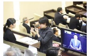
傍聴席に「要約筆記通訳者」「手話通訳者」がそれぞれ派遣された

お知らせしたい情報がまだまだたくさんあります。議会に関する資料がそれぞれ閲覧可能となっておりますのでQRコードよりアクセスしてみてください。