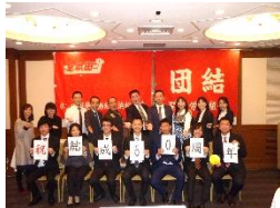
ホンダ開発労組結成50周年記念イベント