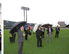
大型スポーツ施設調査特別委員会視察