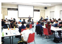
本田労組 役員研修会