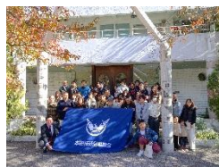
本田労組 組合員レク