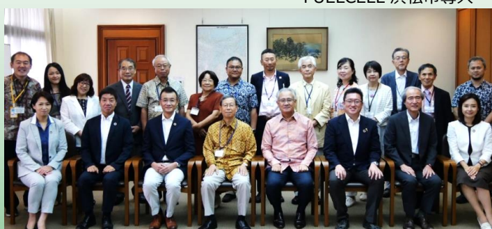
インドネシア共和国国会派視察(日本大使館)