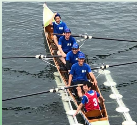
全国市町村対抗レガッタ日田大会決勝