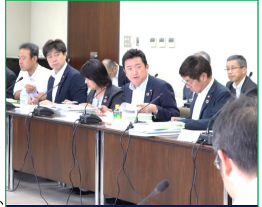
決算特別委員会第1分科会

本市は多発する自然災害被害など不測の事態が生じても安定的かつ継続的に住民サービスを提供できる健全な財政運営を実行しています。今後の財政需要として、公共施設の老朽化対応などの大型投資が控えている中、超高齢化社会により扶助費も拡大し厳しい財政運営となる見込みです。引き続き、市債に頼らない財政運営、自分自身や助け合いでできることは自分たちで行う市民協働、民間でできることは民間で行う民間活力の導入、ネーミングライツや広告収入など税外収入の確保など、健全な財政運営を求めています。