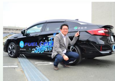
燃料電池車CLARITY FUELCELL 浜松市導入