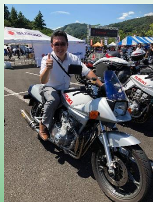
第一回KATANAミーティング