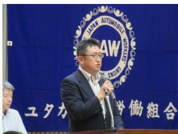
ユタカ技研労組定期大会