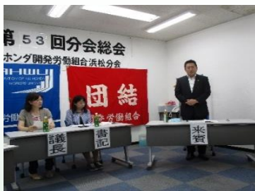
ホンダ開発労組浜松分会総会