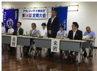
アツミテック労組定期大会