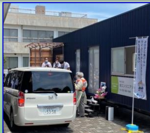
隔離壁を取り付けた浜松市公用車(ステップワゴン)にてドライブスルーによるPCR検査を実演