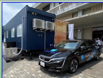
トレーラーハウスへ電気を供給する浜松市公用車(ホンダクラリティ)