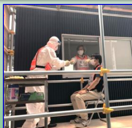
(株)旭エンジニアリングより無償貸与されたトレーラーハウスでの検査風景

ドライブスルー検査も対応でき、導入後は100件/日の検査が可能となります! 市民クラブが要望した検査体制の拡充が図られました!!