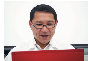
本田技研労組栃木支部 新入組合員セミナー (Web会議)