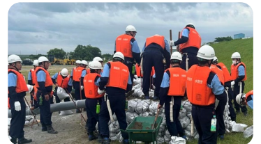
【6月2日】 浜松市水防団 水防演習の視察