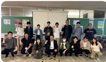
【5月27日】 ホンダロジスティクス労働組合 静岡ブロックでの意見交換会