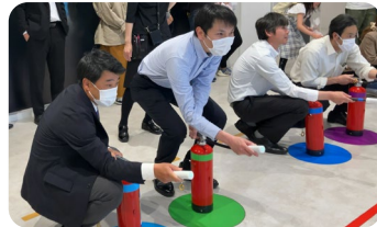
【4月20日】 阿倍野防災センターでの 消火器使用体験