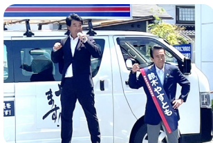
【5月17日】 静岡県知事選挙での 応援演説