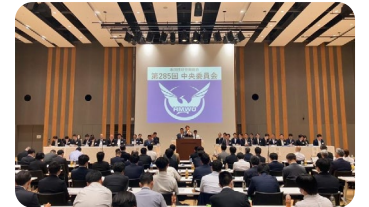
【5月15日】 本田技研労働組合 中央委員会での活動報告