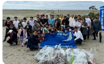
【6月1日】 全本田労連 静岡地協 社会貢献活動への参加