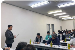
【3月26日】 連合静岡浜松地域協議会 幹事会での活動報告