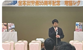
【5月12日】 全本田労連静岡地協 55周年記念レクでの活動報告