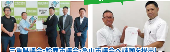
三重県議会・鈴鹿市議会・亀山市議会へ請願を提出し、各級議会より国の関連機関へ意見書が提出されました!