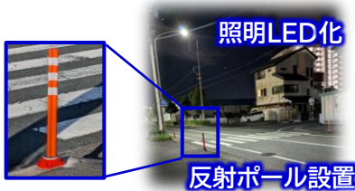
照明LED化 反射ポール設置