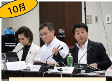
R5決算審査特別委員会