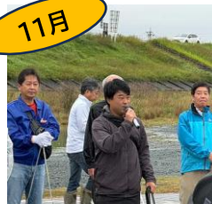
連合静岡浜松地協 列島クリーンキャンペーン