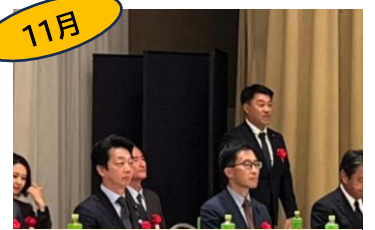
連合静岡浜松地協 第13回定期大会