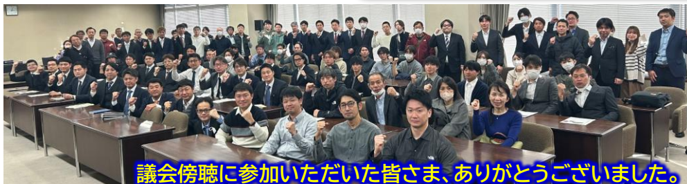
議会傍聴に参加いただいた皆さま、ありがとうございました。