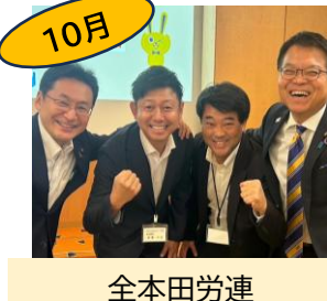
全本田労連 政治政策責任者会議