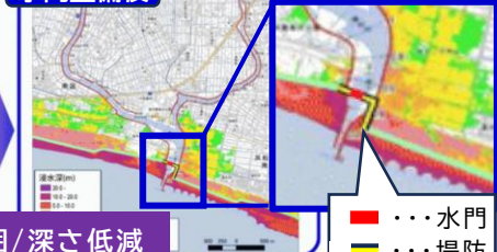
浸水範囲/深さ低減