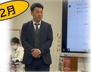
全本田労連 静岡地協幹事会