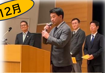
自動車総連静岡地協 政策推進コンベンション