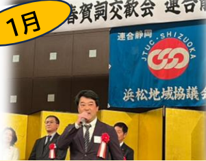
連合静岡浜松地協 新春賀詞交歓会