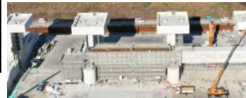
水門整備工事の様子(令和7年1月)