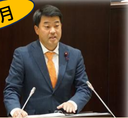
令和6年11月定例会 一般質問